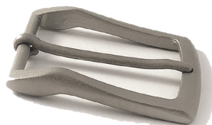
Acciaio opaco Matt steel