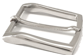
Acciaio lucido Shiny steel