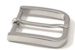
AC004/35 € 6,90