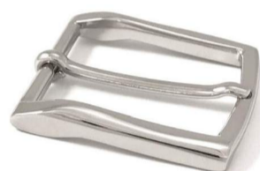
AC001/35 € 6,90

è composta da 6 diversi modelli con altezza 35mm tutti offerti con servizio stock service senza minino quantitativo ordinabile*