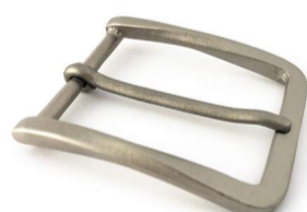
acciaio opaco € 5,90