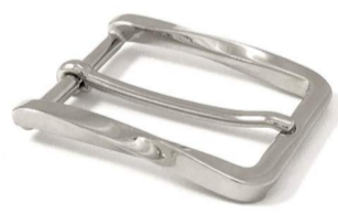
acciaio lucido € 6,90