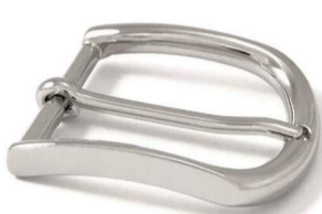
AC002/35 € 6,90