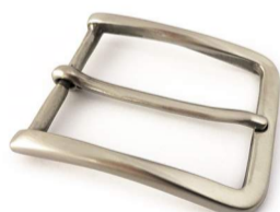
acciaio satinato € 7,40