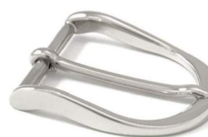
AC003/35 € 6,90