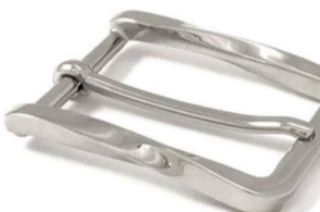
AC006/35 € 6,90

*È possibile realizzare fibbie su disegno