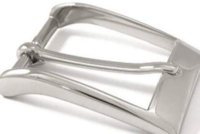
AC005/35 € 6,90