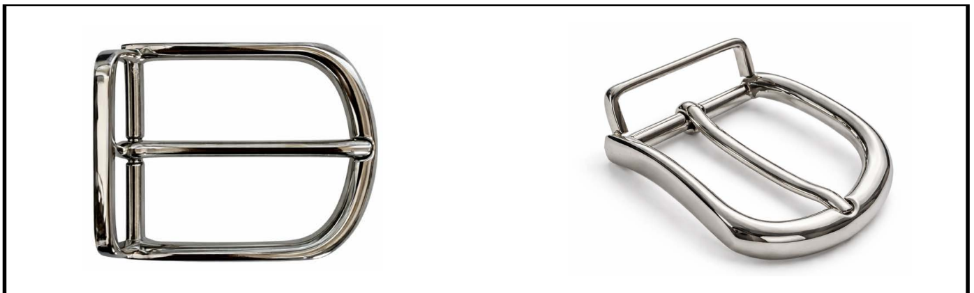
E1332/35 mm NICKEL LUCIDO/SHINY NICKEL €