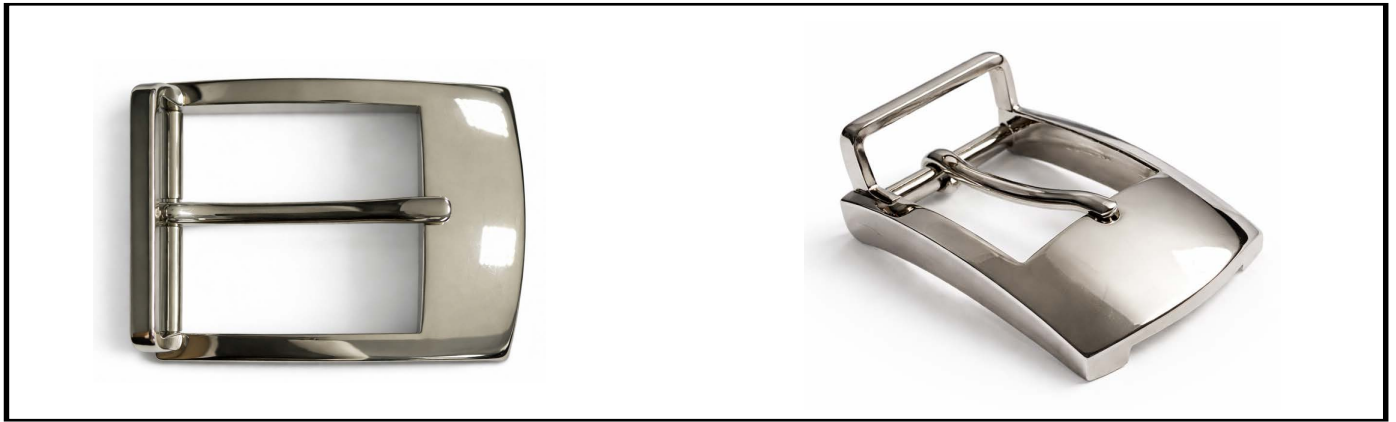
E1337/32 mm NICKEL LUCIDO/SHINY NICKEL €