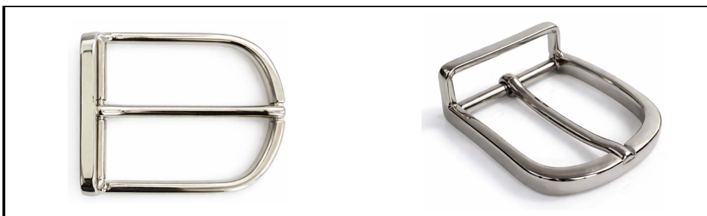
E1335/35 mm NICKEL LUCIDO/SHINY NICKEL €