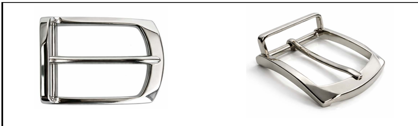
E1331/35 mm NICKEL LUCIDO/SHINY NICKEL € 12,35