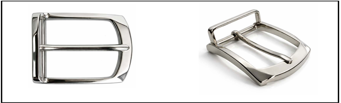
E1331/35 mm NICKEL LUCIDO/SHINY NICKEL €