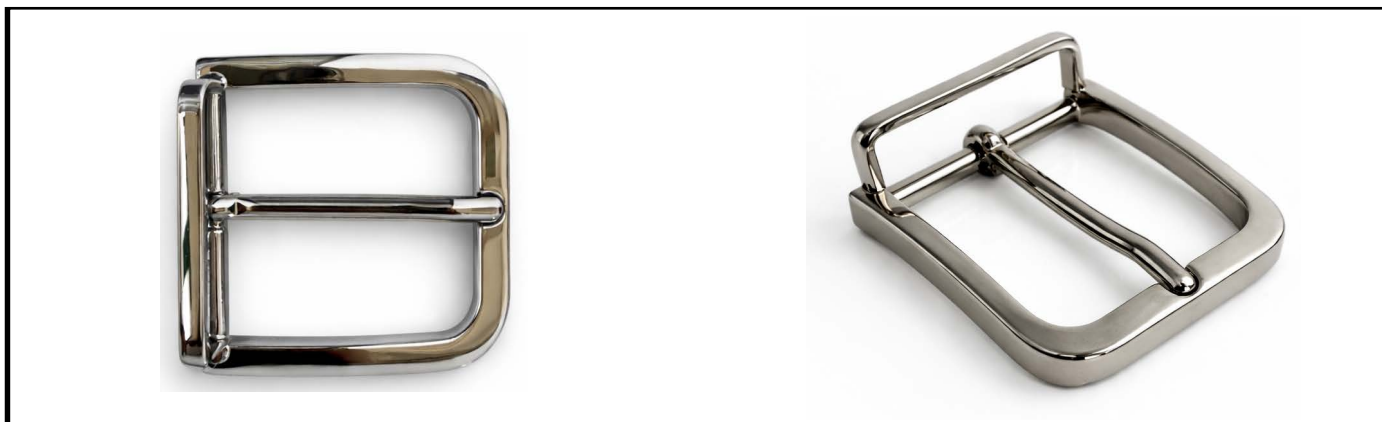
E1334/35 mm NICKEL LUCIDO/SHINY NICKEL €