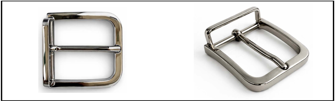
E1334/35 mm NICKEL LUCIDO/SHINY NICKEL € 12,35