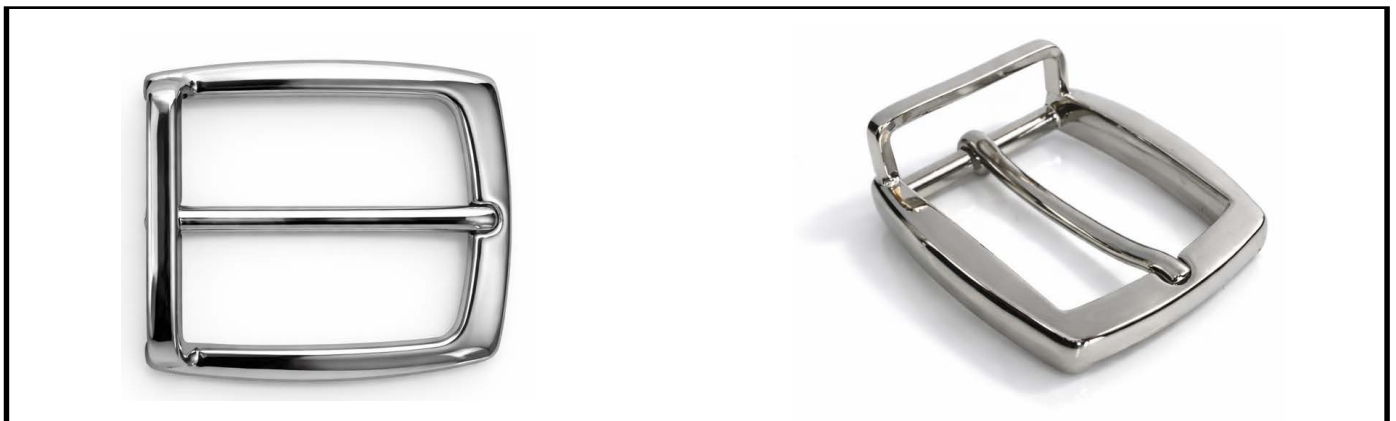
E1338/32 mm NICKEL LUCIDO/SHINY NICKEL €