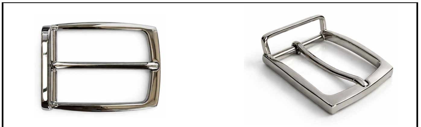
E1333/35 mm NICKEL LUCIDO/SHINY NICKEL €