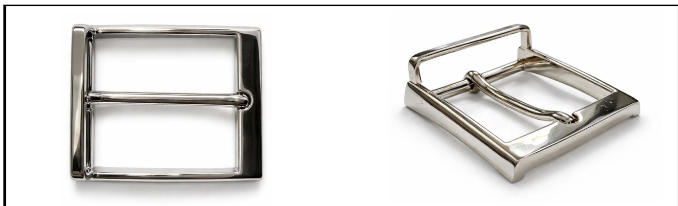
E1336/35 mm NICKEL LUCIDO/SHINY NICKEL €