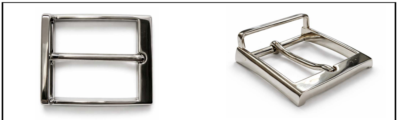
E1336/35 mm NICKEL LUCIDO/SHINY NICKEL € 12,85